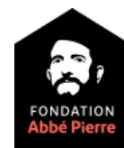
La Fondation Abbé Pierre